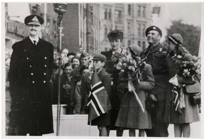
Kong Haakon VII (til venstre) tilbake i Norge 7. juni 1945 etter å ha vært flyktning i England under krigen.

Men Luis venner seg etter hvert til navnet, og når første verdenskrig bryter ut i 1914, er han allerede blitt vant til å kalles Håkon. Hans kjære Julia kaller ham uansett bare «elskling». Han blir enig med regjeringa og Stortinget om at Norge skal være nøytrale under krigen, selv om de i praksis støtter de allierte. Denne strategien viser seg imidlertid ikke å holde når andre verdenskrig bryter ut i 1939, for året etter, tidlig om morgenen 9. april, våkner han igjen av at noen banker hardt på døra. «Deres majestet, du må våkne! Tyskerne har i natt tatt Danmark, og tyske tropper er allerede på vei til Oslo. Deres majestet må flykte».