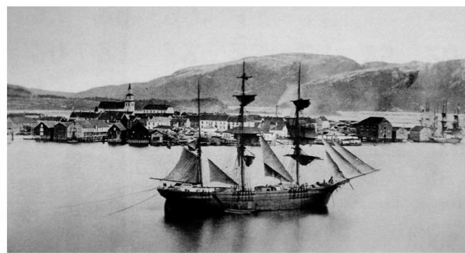
Emigrantskip fra Namsos 1869.

Så kjente han ei hand på skulderen. Det var bibliotekaren. «Du snorker». «Å beklager så mye, jeg sovnet visst».