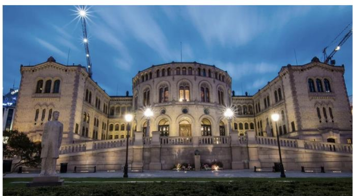
Stortinget i Oslo.

Han leste om tida da Norge var underlagt Danmark. Han leste om hvordan den katolske kirka mistet sin makt i 1536 da protestantismen ble innført i Danmark. Han leste om alle krigene mellom Danmark-Norge og Sverige, og om eksporten av trelast, tørrfisk og sild fra Norge, og etter hvert også metaller, som sølv og kopper. Han leste om hvordan Danmark havnet i krig med Storbritannia og hvordan de valgte feil side under Napoleonskrigene på begynnelsen av 1800-tallet, og han leste om hvordan Norge - som et resultat av dette - ble overgitt til Sverige gjennom en fredsavtale i 1814. Han leste om at Norge samtidig fikk sin egen grunnlov og på denne måten også delvis selvstendighet. Han leste og leste, og øynene ble så tunge, så tunge, og til slutt lukket de seg helt.